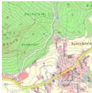
2 – Übersichtskarte

Wenn man die Orte seiner Exkursion festgelegt hat, geht es ans Sammeln des Kartenmaterials. Wer mit der Zeit geht, kann durch die Karten des BayernAtlas Mobile navigieren, was gut funktioniert, aber vielleicht unpraktisch in der Natur ist. Empfehlenswert ist es daher, von dem zu besuchenden Ort Ausdrucke in unterschiedlichen Zoomstufen zu machen; ich verwende neben einem Ausschnitt der näheren Umgebung (1 – dabei auf Anhaltspunkte wie Wege, Straßen zur Orientierung achten) auch einen zweiten Ausdruck mit einer Karte der weiteren Umgebung (2 – überregional) inklusive Ortsnamen zur Anfahrt. Hilfreicher Tipp: Immer darauf achten, dass ein Längemaß auf dem Ausdruck zu sehen ist, um Distanzen dann vor Ort abschätzen zu können!