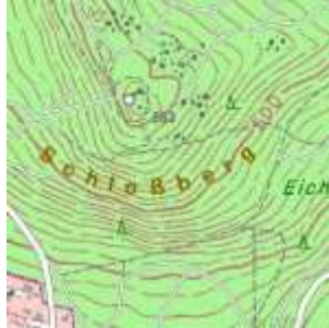
1 – Detailansicht